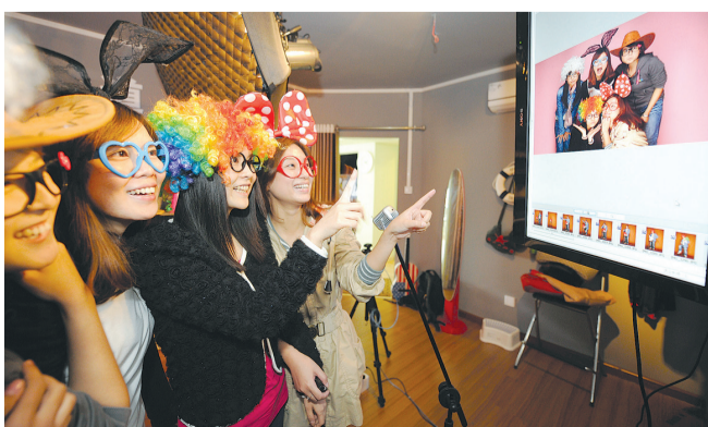
Des clientes choisissent des images dans un studio de selfie à Chongqing.

eXTP et professeur à l'université de Tuebingen en Allemagne, y voit un projet enthousiasmant qui a non seulement mis en évidence l'histoire de la collaboration entre la Chine et l'Europe, mais également séduit des universitaires dans le monde entier. « Il va ouvrir une nouvelle fenêtre permettant à la recherche de base de comprendre la physique fondamentale de l'univers. Pour la première fois, nous allons peut-être pouvoir étudier des phénomènes physiques qui sont trop extrêmes pour les laboratoires sur la Terre ».