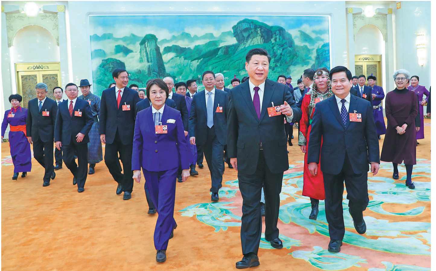
Le Président Xi Jinping se joint aux députés de la région autonome de la Mongolie intérieure pour une discussion de groupe sur le rapport d'activité du gouvernement lors de la première session de la 13ème Assemblée populaire nationale ouverte le 5 mars à Pékin.

« Par exemple, elle a été telle qu'elle a fait évoluer le secteur des cosmétiques en le forçant à faire plus de produits de maquillage pour les jeunes dames à base d'eau plutôt qu'à base d'huile. Les jeunes femmes adorent prendre des selfies le matin quand leur maquillage est frais ; or, des cosmétiques à base d'huile gâcheraient un auto-portrait parfait en leur donnant une apparence grasseuse ».